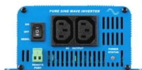
Phoenix 12/350 Enchufes IEC-320