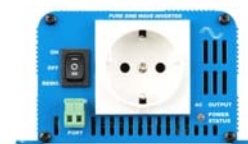
Phoenix 12/180 Enchufe Schuko